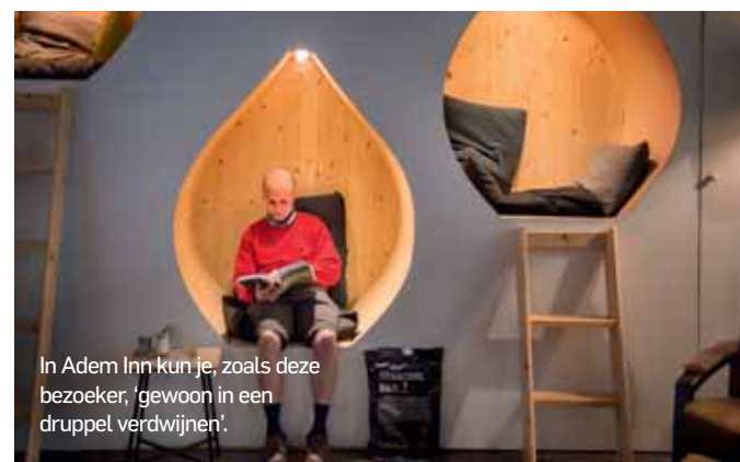
In Adem Inn kun je, zoals deze bezoeker, 'gewoon in een druppel verdwijnen'.

Het is rustig vandaag in Adem Inn. Alleen een buurtbewoner komt even in de stilte ruimte zitten, om wat te werken. Op een van de eerste mooie zonnige dagen van het jaar zijn de meeste mensen logischerwijs