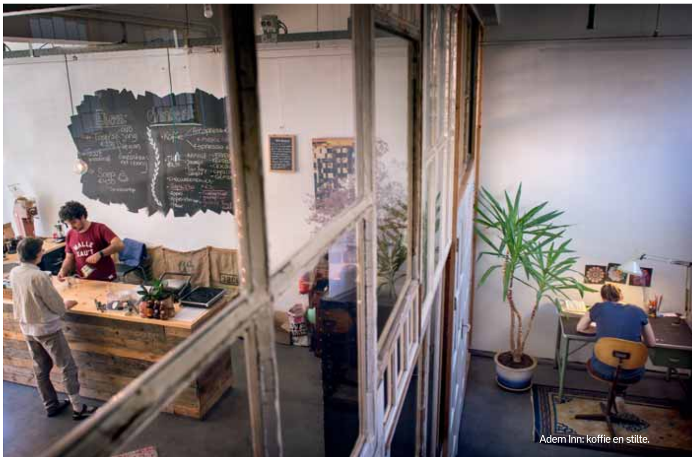
Adem Inn: koffie en stilte.

Adem Inn, stiltecafé met goede gesprekken