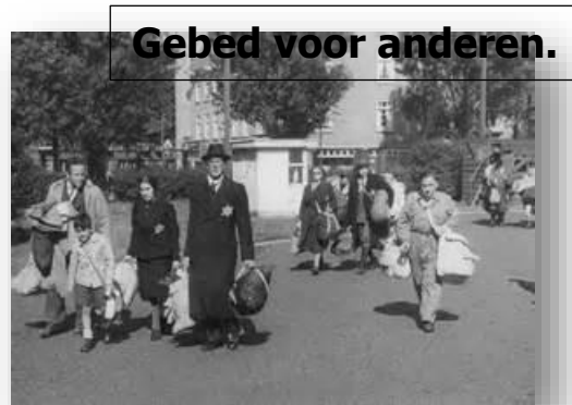
Gebod voor anderen.

zijn ingetrokken. 'Ik bereidde me al op het ergste voor.' Edith Stein was vóór haar: 'Ook haar uitstel was ingetrokken. Ze zag er bleek maar gelaten uit, troostte nog haar lotgenoten.'