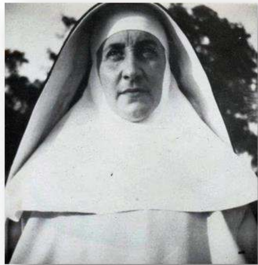
Foto genomen door haar broer Bram in Bilthoven ma haar voorlopige in vrijheidstelling op 15 augustus 1942.