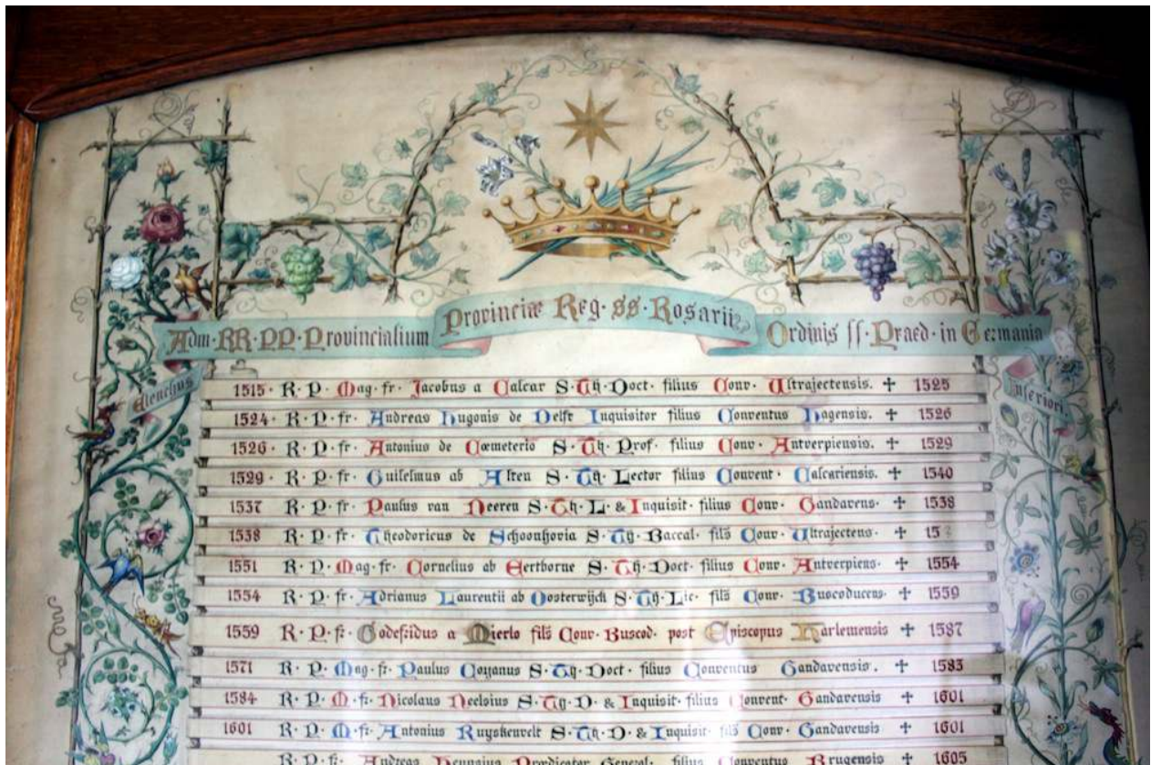
Bovenste gedeelte van het middenpaneel van de vijfluk op het provinciaalaat; foto: Natascha Esser

Op het provinciaalaat in Berg en Dal hangt een schitterend vijfluk - afkomstig uit het Albertinum - met de namen van de provinciaals.