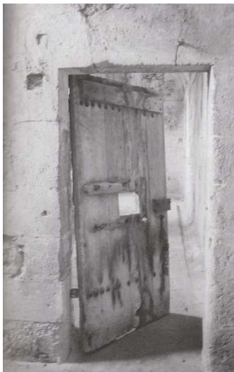
Dit is de uitgang van tuchthuis Cadillac.